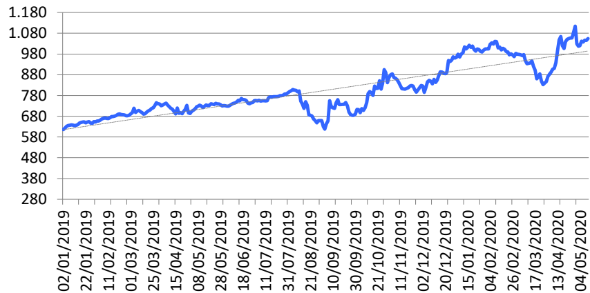
Tendencia del índice del valor nominal diario de la cuotaparte Clase B (índice base: 01/07/2013=100)

El índice de la cuotaparte del fondo se encuentra en línea con el índice promedio de fondos comparables en el mismo período considerado.